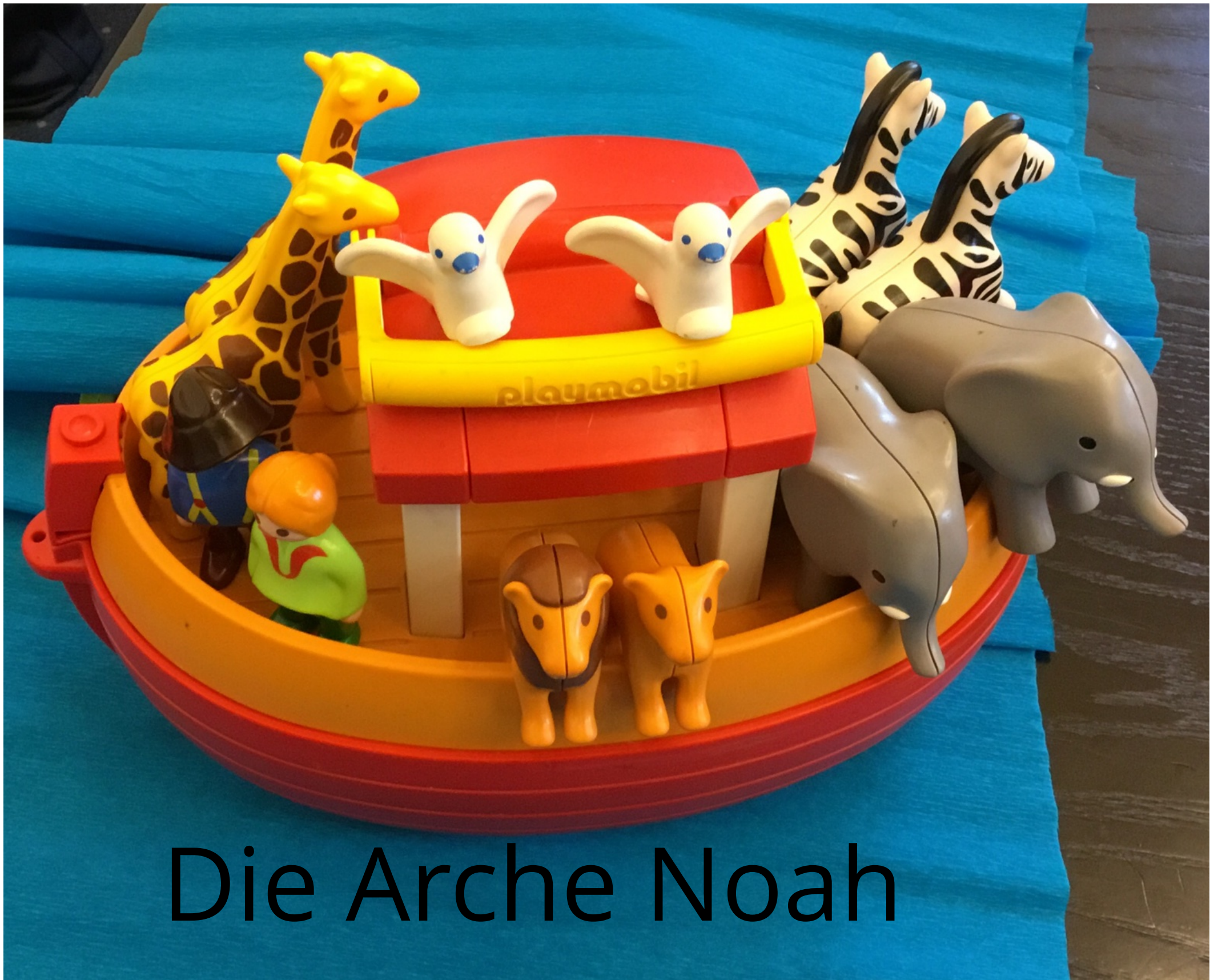
Die Arche Noah