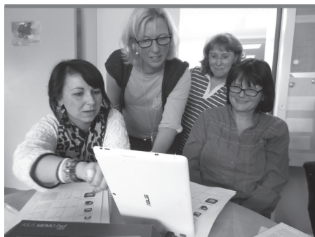
Abb. 2: Das Team der Kita Robinsbalje setzt sich mit dem Bildungspotenzial von Tablets auseinander.