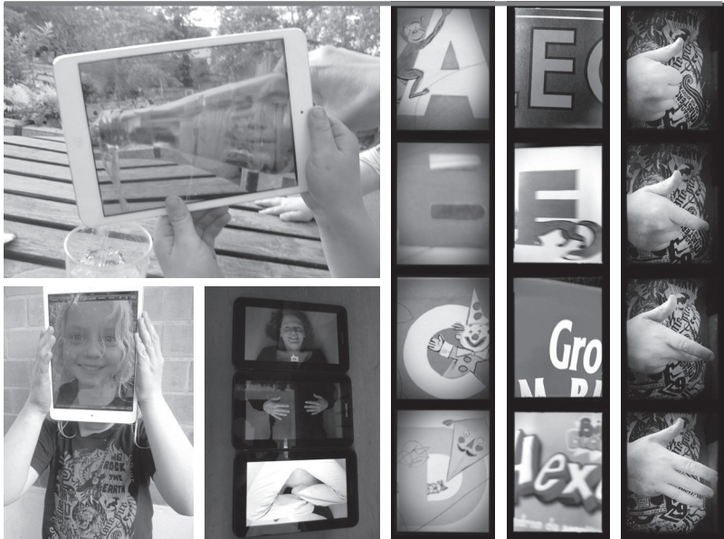
Abb. 7-12: Beispiele für „App-Spielchen“

Beine fotografiert werden. Dann werden die drei Tablets zusammengelegt und durch „Wischen“ entstehen immer neue Mix-Max-Menschen. Mehrere Hände und ein bisschen Geschick sind gefragt, wenn Wasser, Saft, Tee oder Kakao „aus dem Tablet“ eingeschenkt werden sollen. Dieses Experiment sollte am besten draußen durchgeführt werden, denn dabei kann es „ganz real“ feucht-fröhlich zugehen.