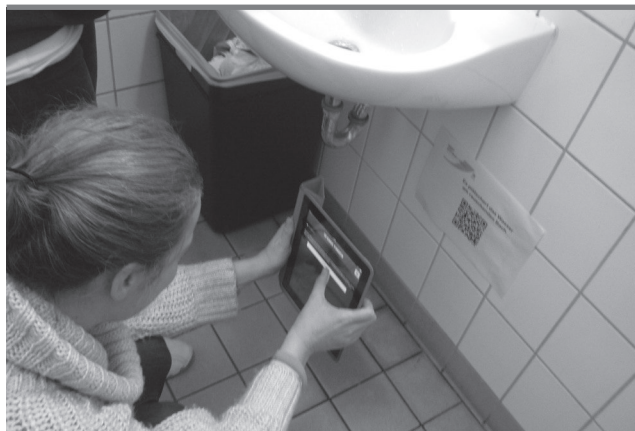
Abb. 13: QR-feldein mit dem Tablet