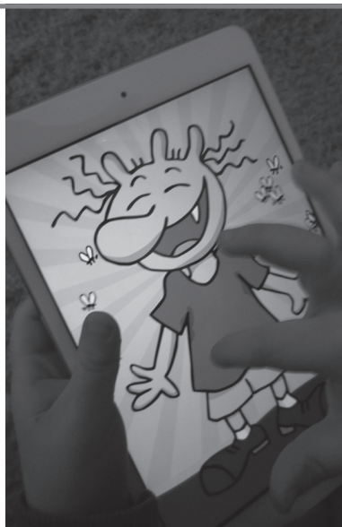
Abb. 5: Olchi-App

Vorauswahl getroffen, thematisch ausgerichtet oder auch als kunterbuntes Geschichten-Potpourri. Das Besondere am digitalen Lesestoff sind die integrierten Spielhäppchen und Mitmachelemente, an denen die ganze Gruppe über den Beamer teilhaben kann. Gemeinsam mit den Kindern können beispielsweise auch Bilderbuch-Apps bewertet und auf einem Kita-Aushang die App des Monats empfohlen werden. Projekte wie Lesestart ( www.lesestart.de ) bieten hier hilfreiche Unterstützung und wertvolle Anregungen.