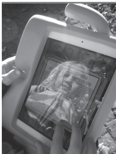
Abb. 1: Tablet in Kinderhände geben

der Mehrwert über die inhaltliche Verknüpfung mit allen maßgeblichen Bildungsbereichen erschließt.