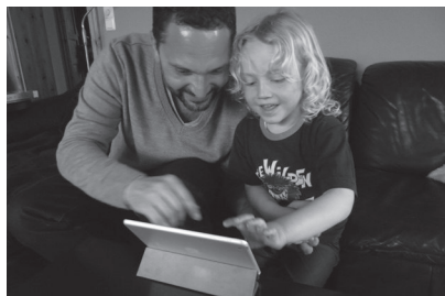
Abb. 6: Gemeinsames Spiel am Tablet