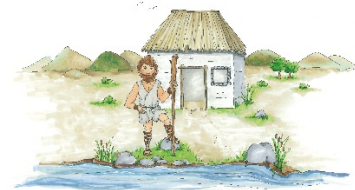
Bild 6_ Offerus vor seinem Haus oder Haus legen

Dann baute er sich am Fluss ein Haus, und von nun an trug er sein ganzes Leben lang Menschen durch den Fluss. Die Menschen waren ihm sehr dankbar. So schützte Offerus das Leben von vielen, vielen Reisenden.