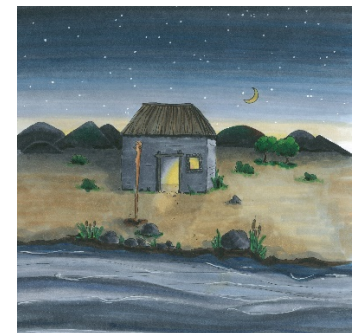
Bild 8_ Offerus' Haus in der Nacht oder durren Ast auf braune Tücher legen

Offerus war ganz verwundert. „Wie kann ich dir das alles glauben?“, fragte er. Das Kind antwortete ihm: „Geh zurück ans andere Ufer. Dort stecke deinen Stab heute Abend in die Erde. Dann leg dich schlafen. Morgen, wenn du aufwachst, wird daraus ein wunderschöner Stamm mit Blättern und Blüten gewachsen sein.“