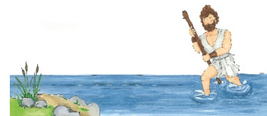
Bild 10_Christophorus als guter Begleiter

Ja, dieser große und starke Christophorus wurde bekannt. Es sprach sich herum, wie aufmerksam und hilfsbereit er war. Wer auch immer seine Dienste brauchte, dem half er. Er war rücksichtsvoll, wenn er die Sorgen und Ängste der Menschen bemerkte, denn alle wollten sicher ankommen. Zuvorkommend war er und strahlte eine große Sicherheit aus, denn er blieb ruhig, selbst wenn das Wasser vom Wind aufgepeitscht wurde. Der Fluss, die Blumen und Bäume am Ufer – ja die ganze schöne Natur waren ihm wie gute Freunde, denn Gott selbst hatte sie gemacht.