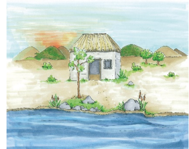
Bild 9_Aus Offerus wird Christophorus oder durren Ast mit Blüten und Blättern schmücken

Ja, dieser große und starke Christophorus wurde bekannt. Es sprach sich herum, wie aufmerksam und hilfsbereit er war. Wer auch immer seine Dienste brauchte, dem half er. Er war rücksichtsvoll, wenn er die Sorgen und Ängste der Menschen bemerkte, denn alle wollten sicher ankommen. Zuvorkommend war er und strahlte eine große Sicherheit aus, denn er blieb ruhig, selbst wenn das Wasser vom Wind aufgepeitscht wurde. Der Fluss, die Blumen und Bäume am Ufer – ja die ganze schöne Natur waren ihm wie gute Freunde, denn Gott selbst hatte sie gemacht.