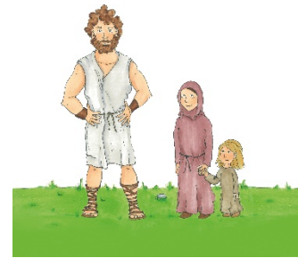
Bild 4_Offerus begegnet dem heiligen Mann oder Figur des alten Mannes zu Christophorus stellen

Er war viel größer und stärker als die anderen Menschen. Deshalb wollte er nur dem stärksten und tapfersten König auf der ganzen Welt dienen. Offerus machte sich auf eine lange Reise, um diesen König zu suchen. Er erlebte viele Abenteuer, aber irgendwie schien es, als könnte er niemals diesen großen König finden.