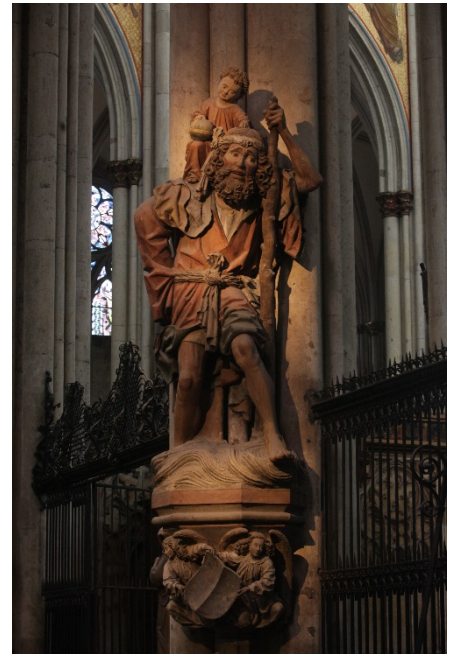
Christophorus im Kölner Dom

Vgl. www.wikipedia.org/wiki/Christophorus und www.heiligenlexikon.de