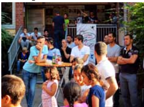
Nachbarschaftsfest „Miteinander“ in Ratingen

Mit unterschiedlichen und gut besuchten Aktionen hat das Projekt „vielfalt. viel wert.“ in 2016 Begegnungen ermöglicht, so etwa in Haan mit dem „One World Day“, dem „Strand International“ und dem Besuch der „Villa Utopia“ an einer Flüchtlingsunterkunft, in Erkrath mit einem Cajón-Workshop für Jugendliche, oder in Mettmann mit einem Stand beim „Welcome Festival“ und dem Podiumsgespräch „Ankommen“. In Ratingen war „Vielfalt“ beteiligt am Nachbarschaftsfest „Miteinander“ und aktuell haben die Arbeiten am „Internationalen Garten“ in Haan begonnen.